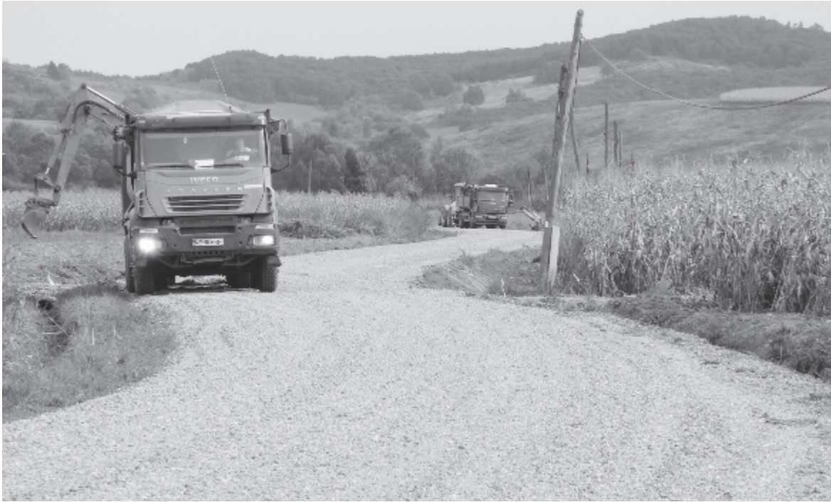
Javában folyik az útalapozás, hamarosan az alapréteget is lefektetik Kisadorjánig